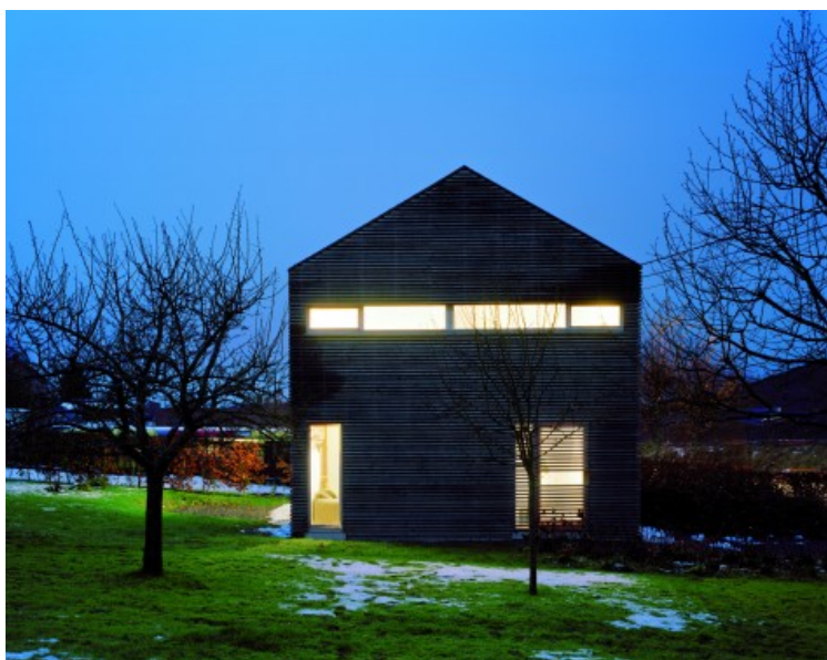
Â© Marie-Françoise Plissart pour les 10 ans de bois et habitat