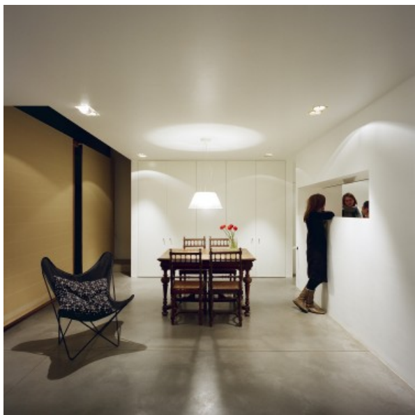
pour les 10 ans de bois et habitat