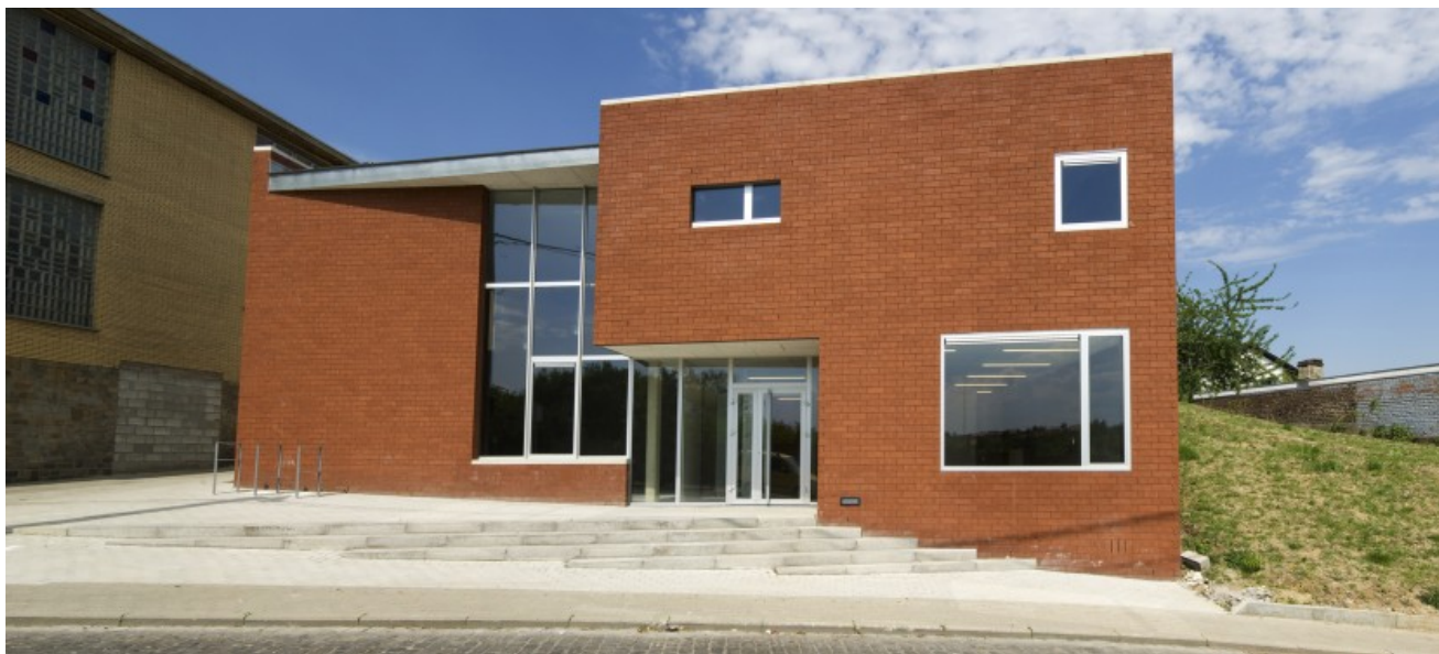
Â© Alain Janssens