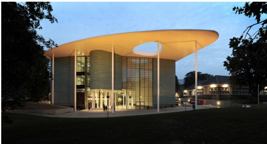
Â© Serge Brison