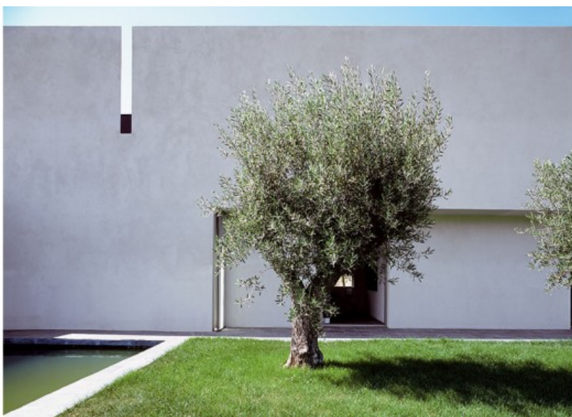
Â© Jean Luc LALOUX