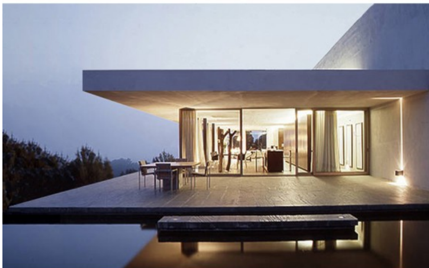
Â© Jean Luc LALOUX