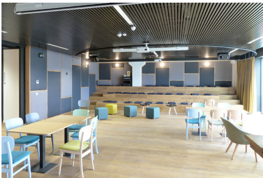
Â© Atelier dâ™ architecture Meunier-Westrade scprl