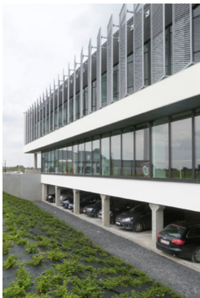
Â© Atelier dâ™ architecture Meunier-Westrade scprl