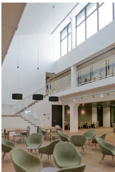
Â© Atelier dâ™ architecture Meunier-Westrade scprl