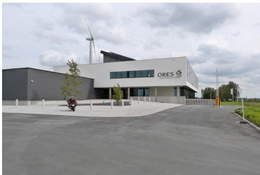
Â© Atelier d'architecture Meunier-Westrade scprl