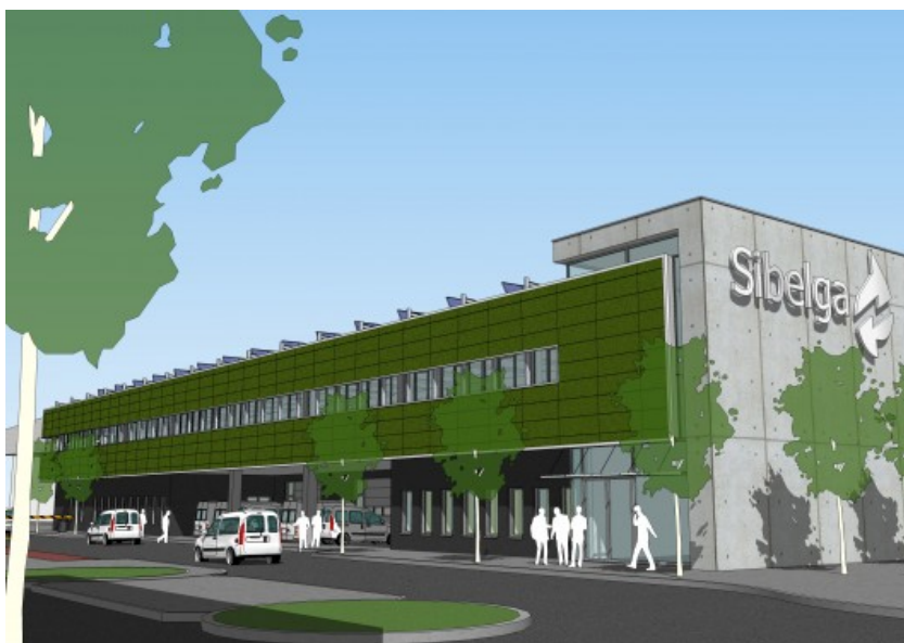
Vue sur la façade principale © g@talis © © CERAU Architects Partners