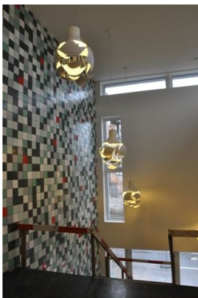
Â© CERAU Architects Partners