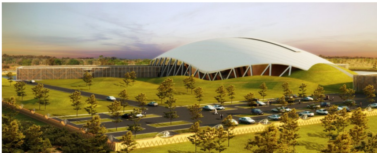
Vue générale 1