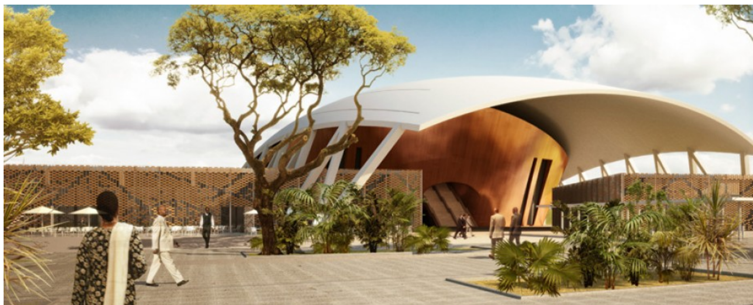
Vue sur l'entrée