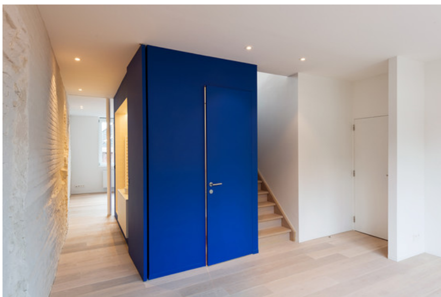
Â© Marie-FranÃ§oise Plissart