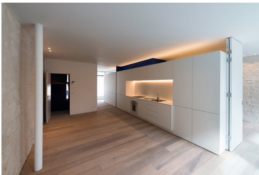
Â© Marie-FranÃ§oise Plissart