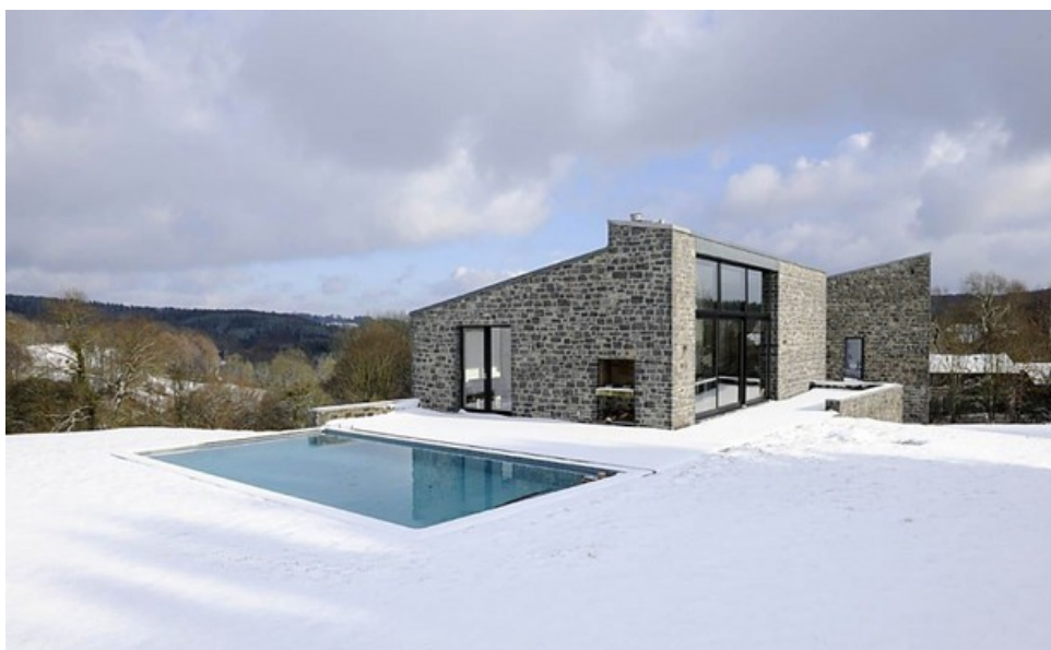
Â© Cabinet d'architectes p.HD