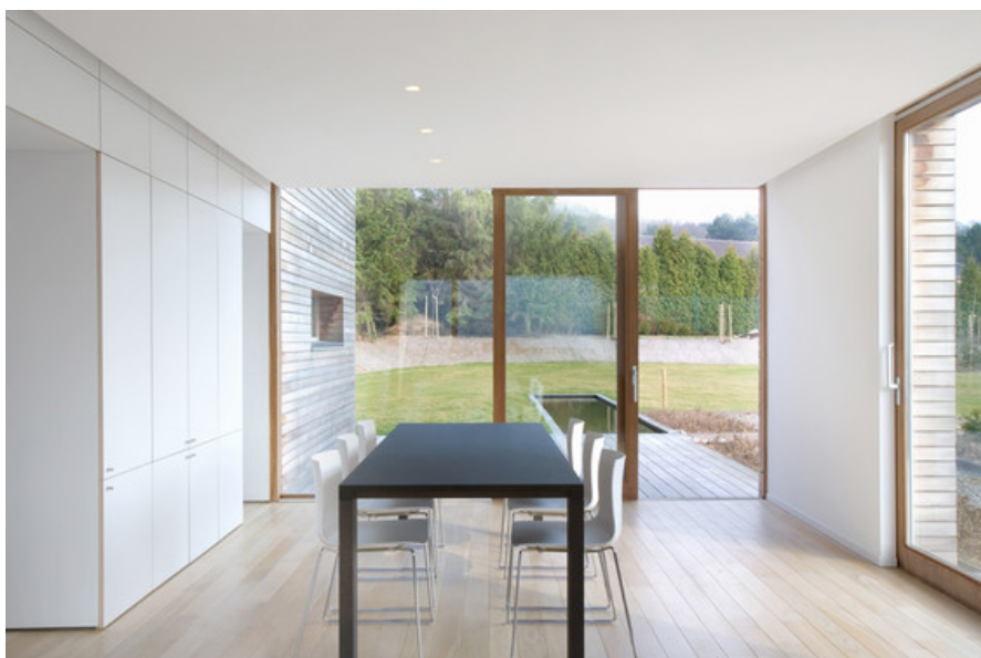
Â© Crahay & Jammaigne