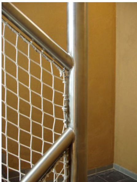
Â© H2A Ir Architecte & AssociÃ©s