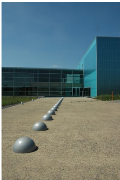
© H2A Ir Architecte & Associés