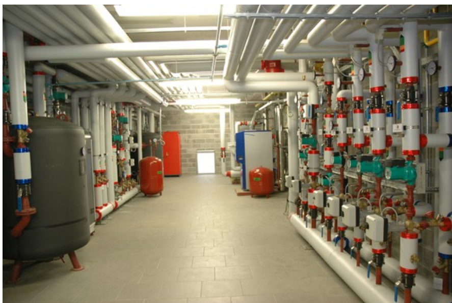
Â© H2A Ir Architecte & AssociÃ©s