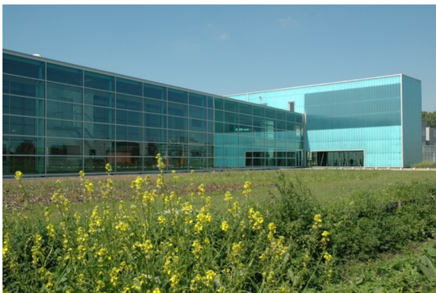
© H2A Ir Architecte & Associés