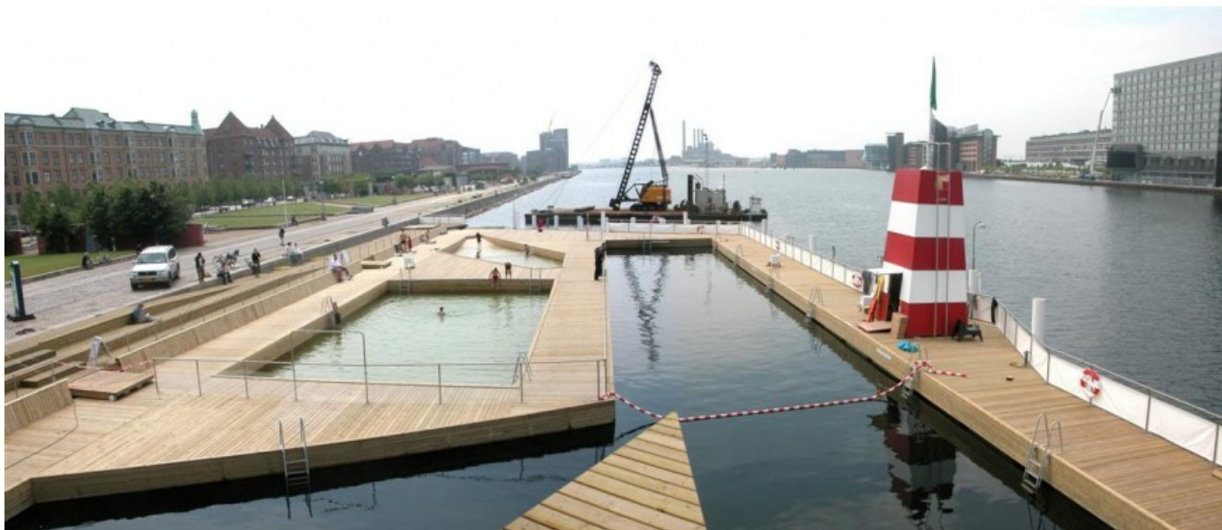
Â© JDS Architects Julien De Smedt