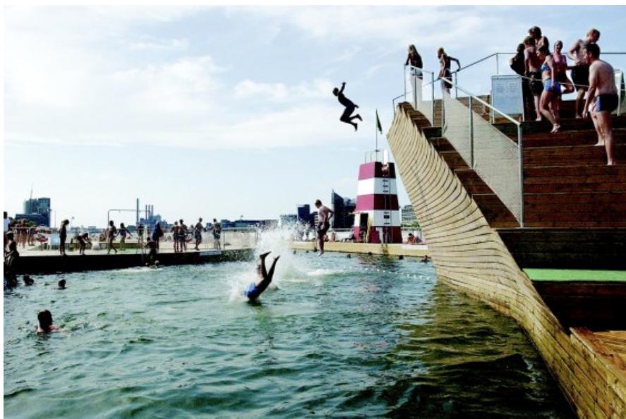
Â© JDS Architects Julien De Smedt