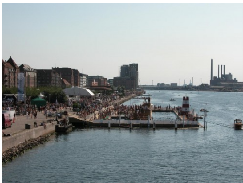
Â© JDS Architects Julien De Smedt