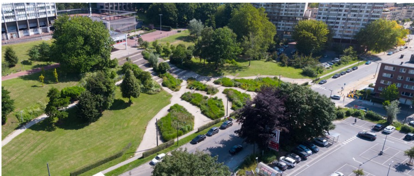
Â© JNC International s.a. "Joining Nature and Cities"