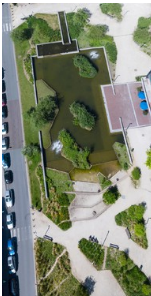
"Joining Nature and Cities"