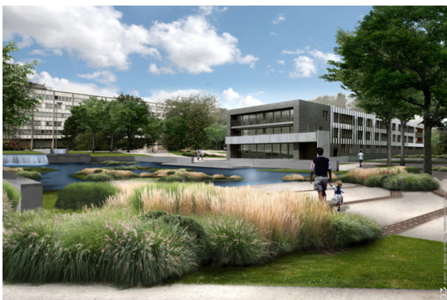
Zone Bassin Â© JNC International s.a. "Joining Nature and Cities"