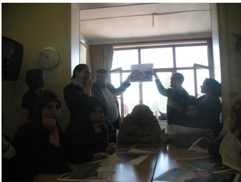
Â© IPE collectif