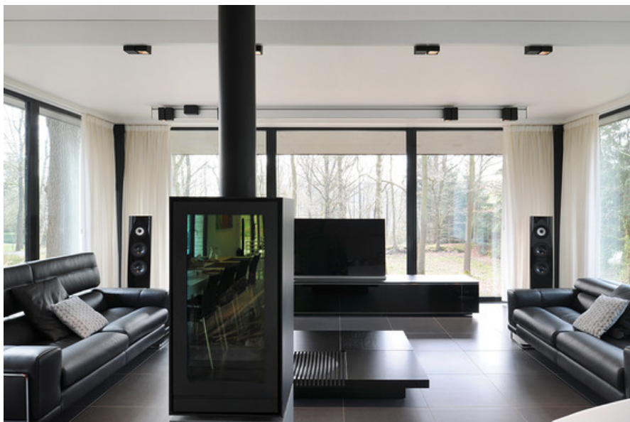
Â© Luc Spits