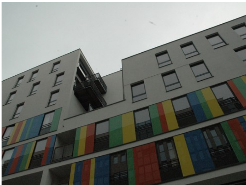
Village L'Opold - architecte: Blondel Â© Ney & Partners