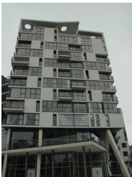
Village L'Opold - architecte: Blondel Â© Ney & Partners