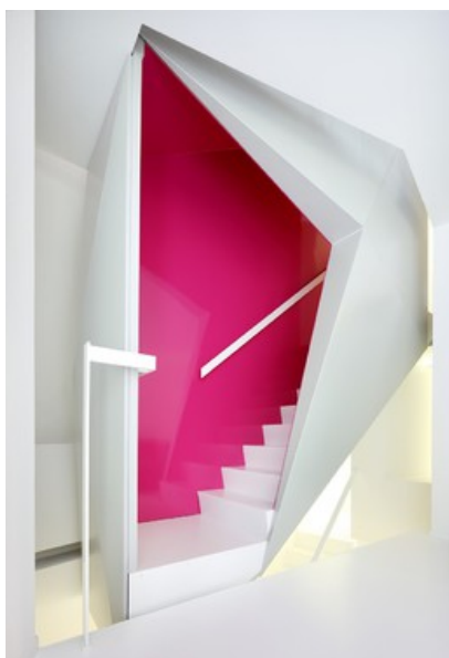
Â© O2 Architectes