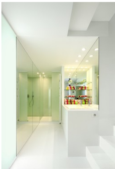
Â© O2 Architectes