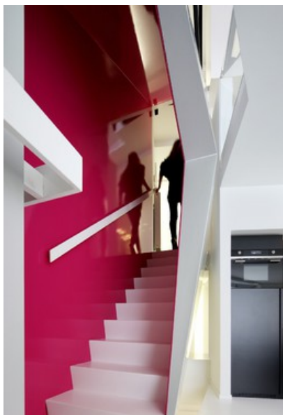
Â© O2 Architectes