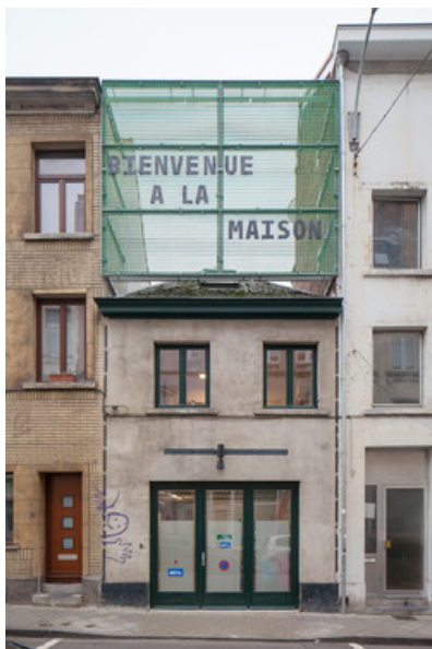
Â© Johnny Umans