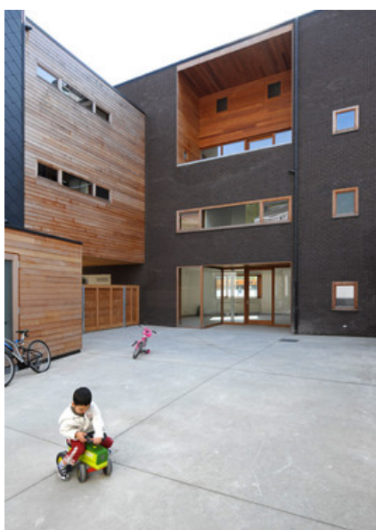
Â© Olivier Fourneau Architecte scprl