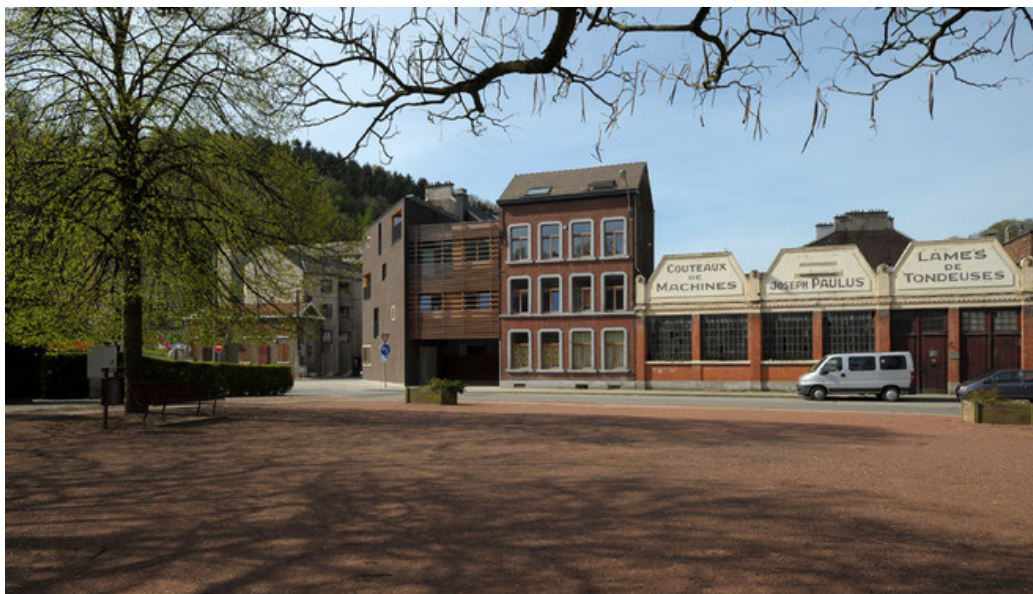
Â© Olivier Fourneau Architecte scprl