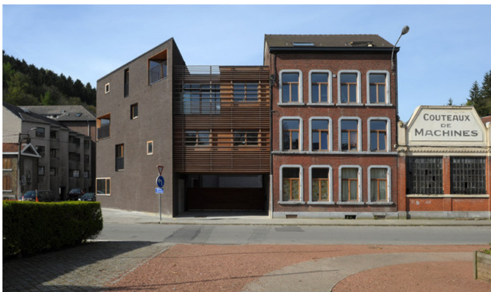
Â© Olivier Fourneau Architecte scprl