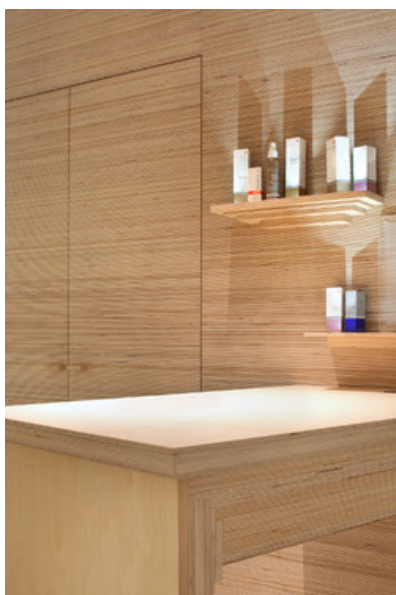
Â© Maxime Delvaux