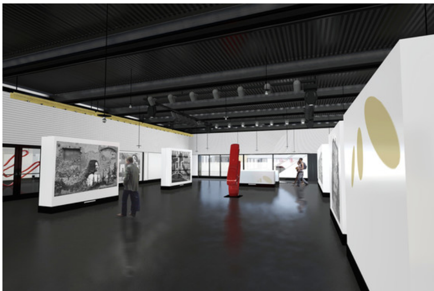
Â© P&P architectes