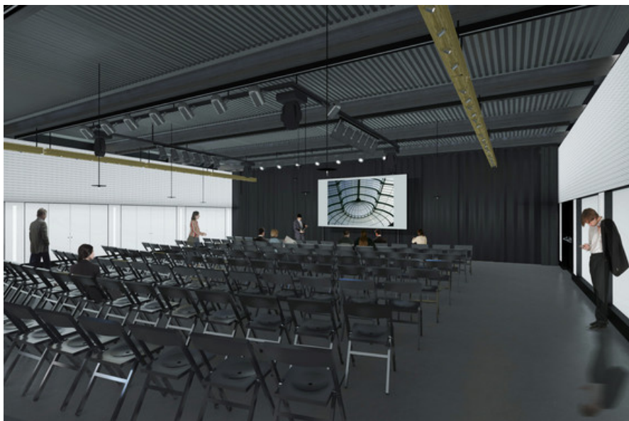
Â© P&P architectes