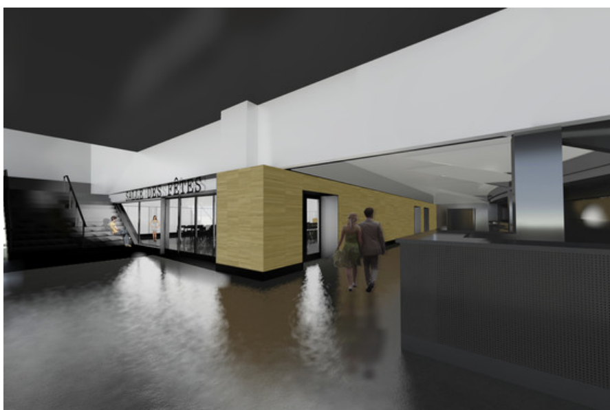
Â© P&P architectes