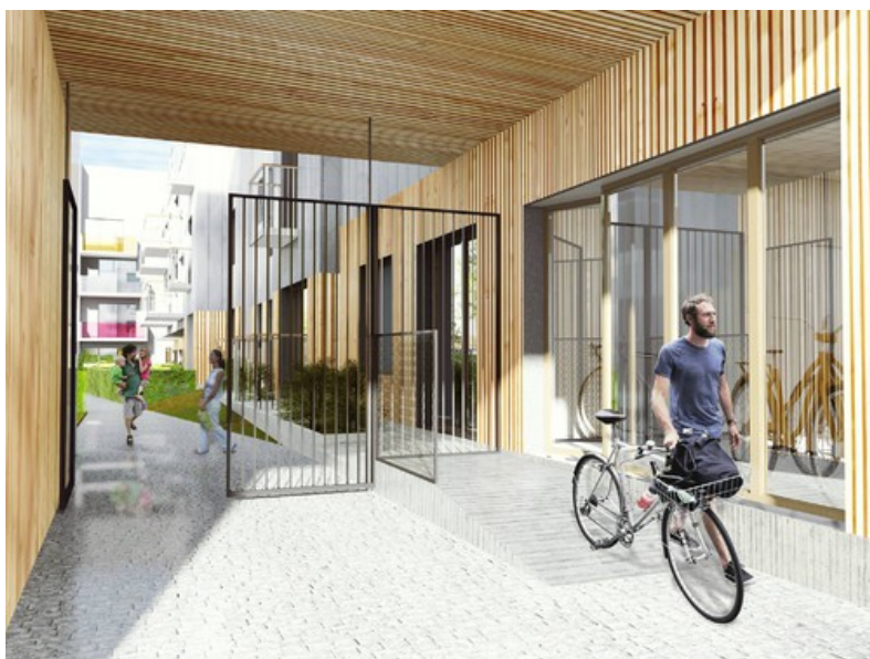
Â© P&P architectes