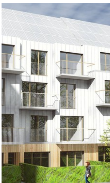
Â© P&P architectes