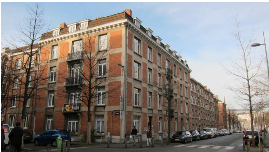
Â© P&P architectes