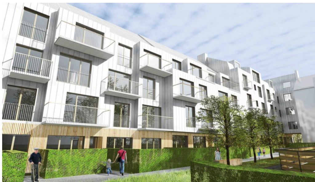
À© P&P architectes