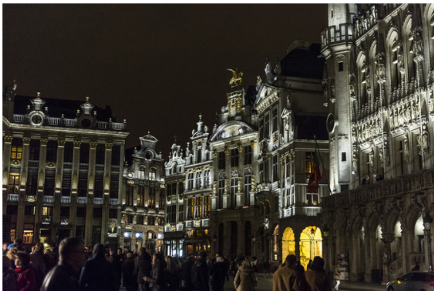
À© Jonathan Berger