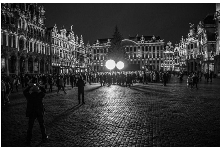
À© Jonathan Berger