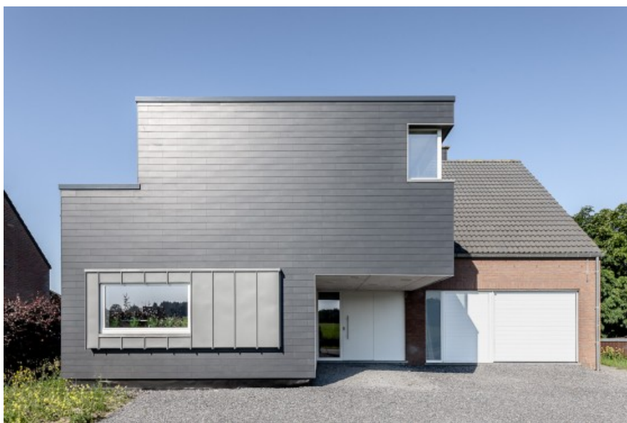
Vue extérieure