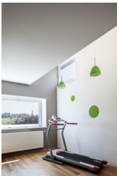
Vue intérieure