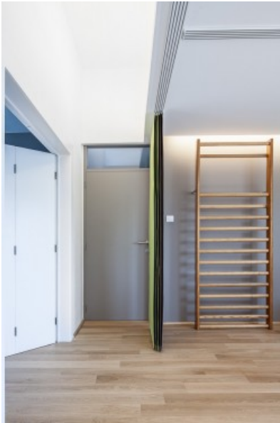
Vue intérieure