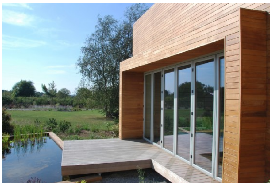
Â© SECHEHAYE Architecture & Design