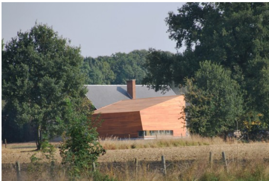
Â© SECHEHAYE Architecture & Design