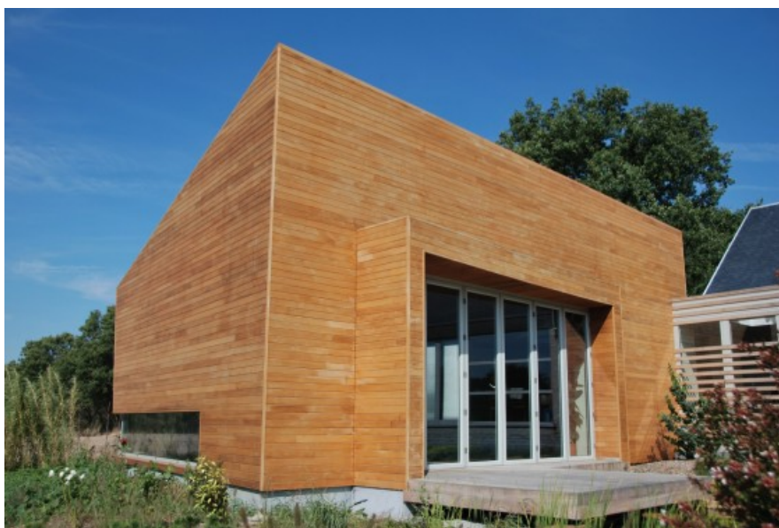
Â© SECHEHAYE Architecture & Design