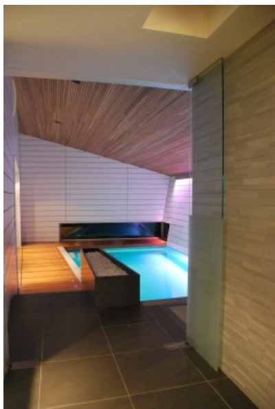
Â© SECHEHAYE Architecture & Design