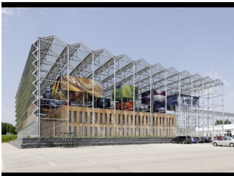
Â© Marie-FranÃ§oise Plissart