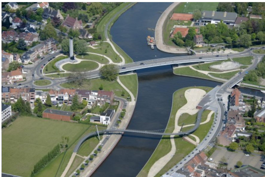
Vue aérienne du parc et des ponts du College et de Groeninghe