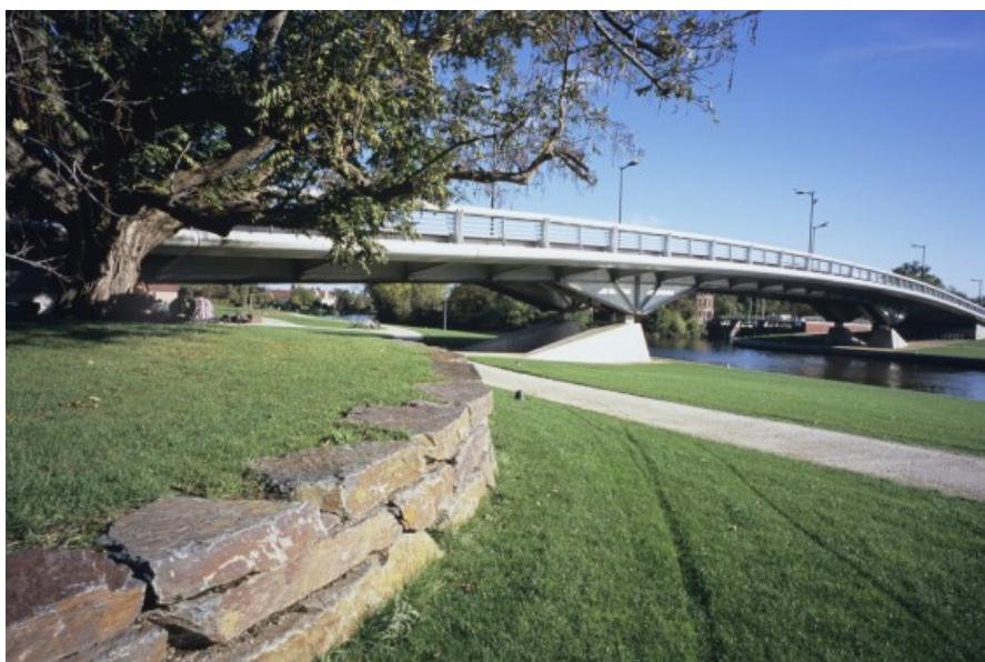
Pont de Groeninghe