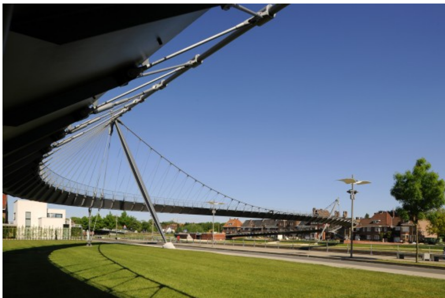
Passerelle du Collège