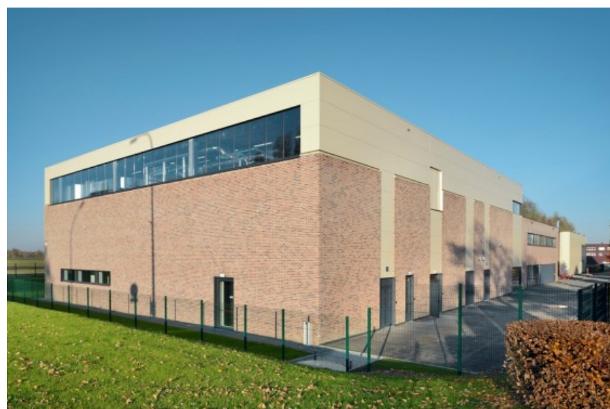
À© Georges De Kinder