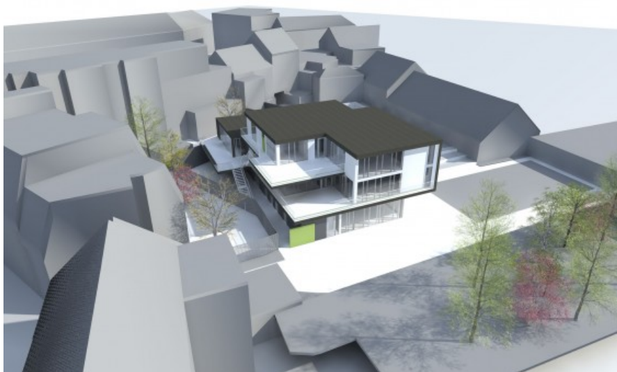
Â© TRAIT norrenberg & somers