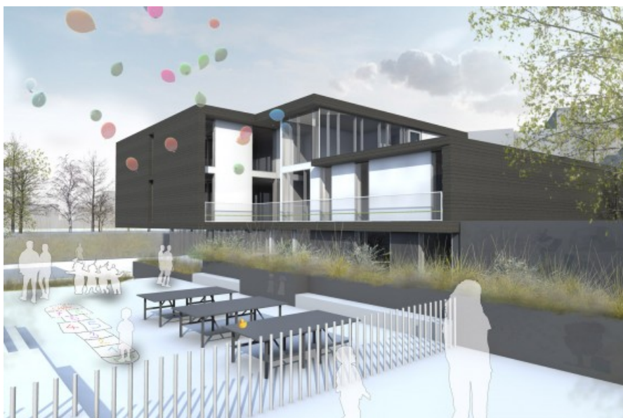
Â© TRAIT norrenberg & somers