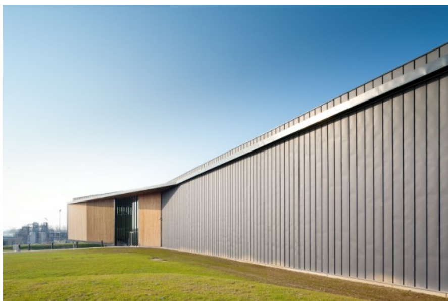
Â© Tim Van de velde