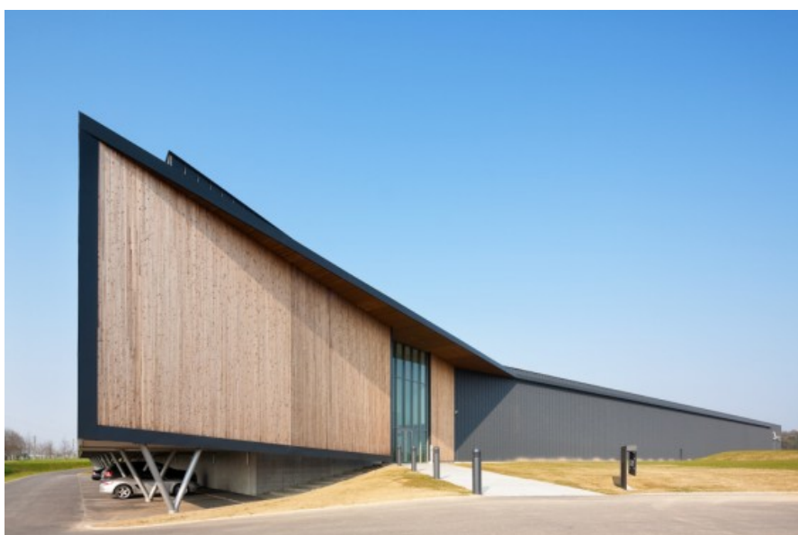
Â© Tim Van de velde