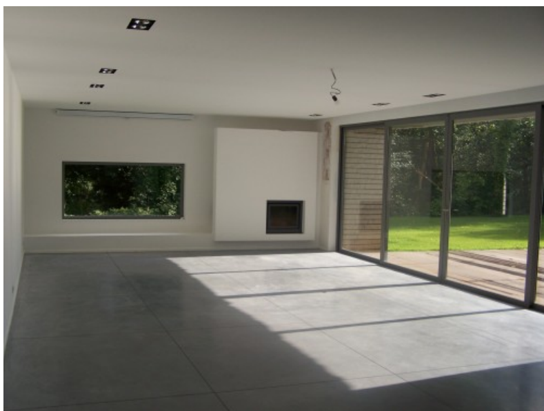
Â© V2W Architectes sprl Â© Â© V2W Architectes sprl