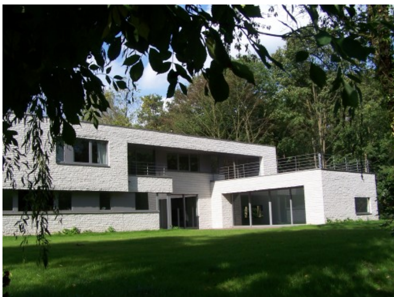
Â© V2W Architectes sprl Â© Â© V2W Architectes sprl