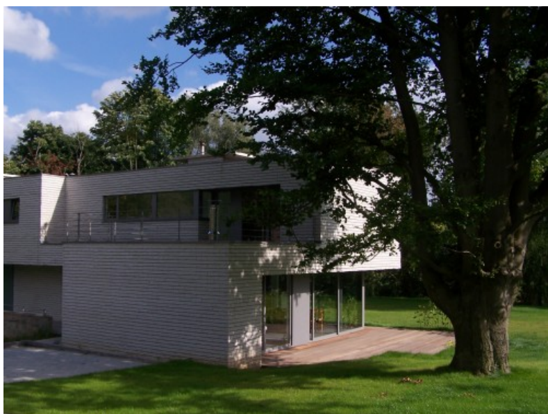
Â© V2W Architectes sprl Â© Â© V2W Architectes sprl