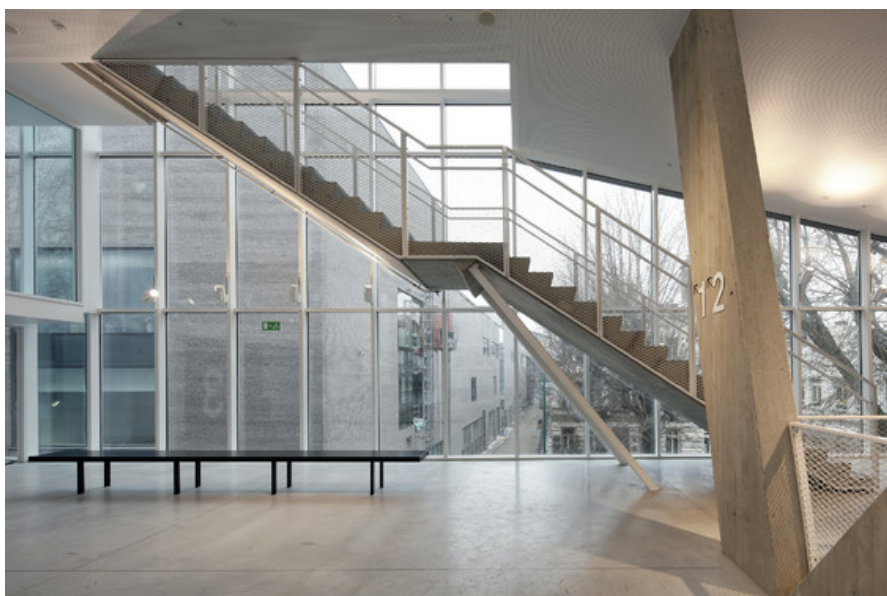
Â© Vers plus de bien-Ã¢tre V+