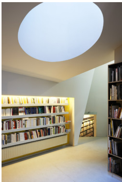
Librairie Pax / nouveaux espaces au R+1