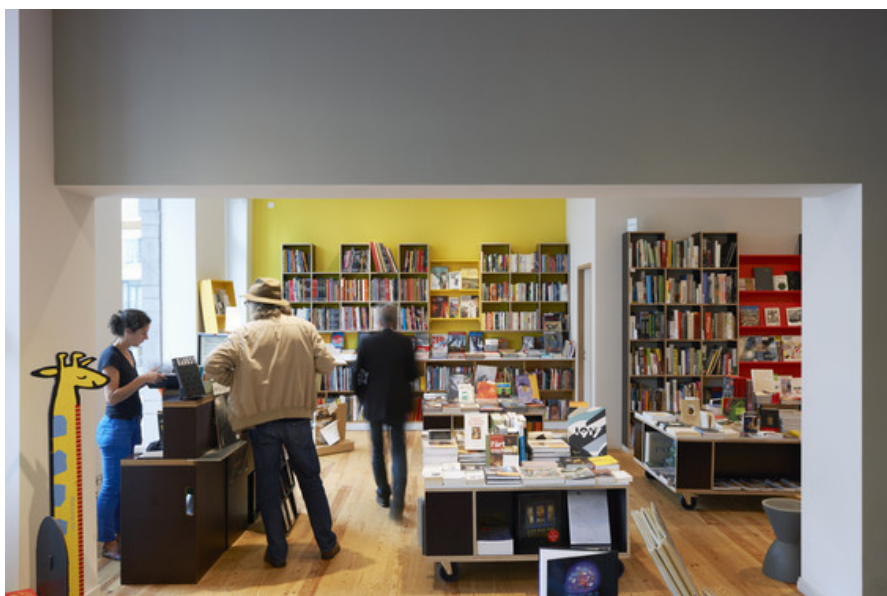
Librairie Pax / nouveaux espaces au R+1