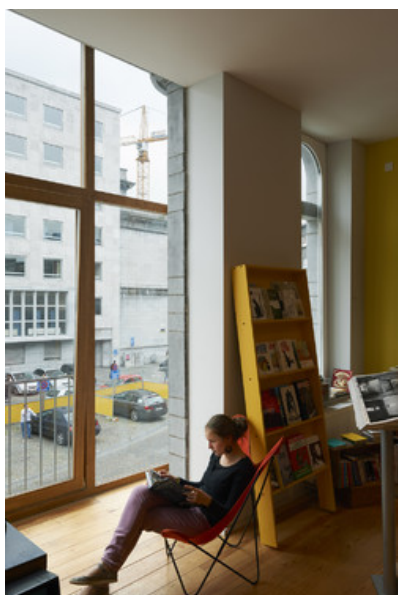
Â© atelier d'architecture Aloys Beguin-Brigitte Massart sprl