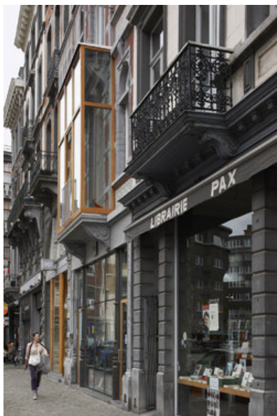
Librairie Pax / façade