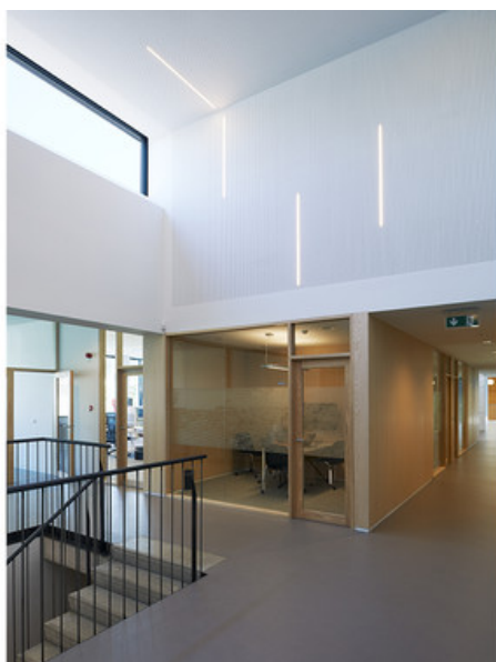
Â© Alain Janssens