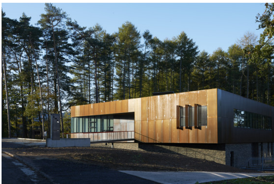
Â© Alain Janssens