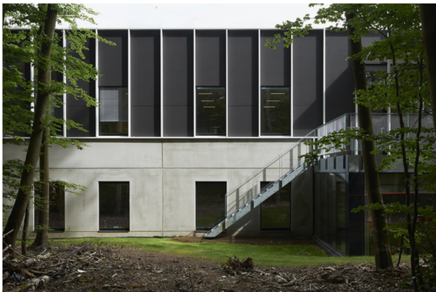
Â© Alain Janssens