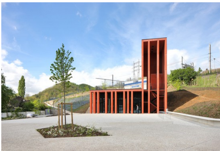
Â© Filip Dujardin