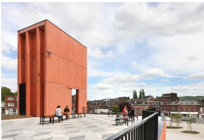
Â© Filip Dujardin