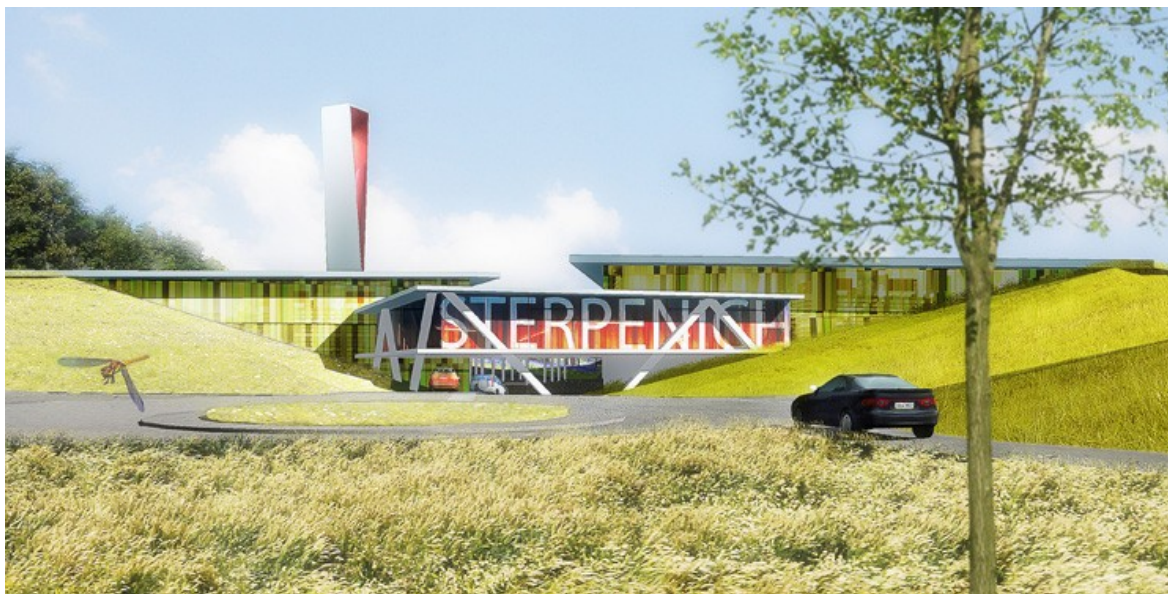
Â© ARJM architecture et urbanisme