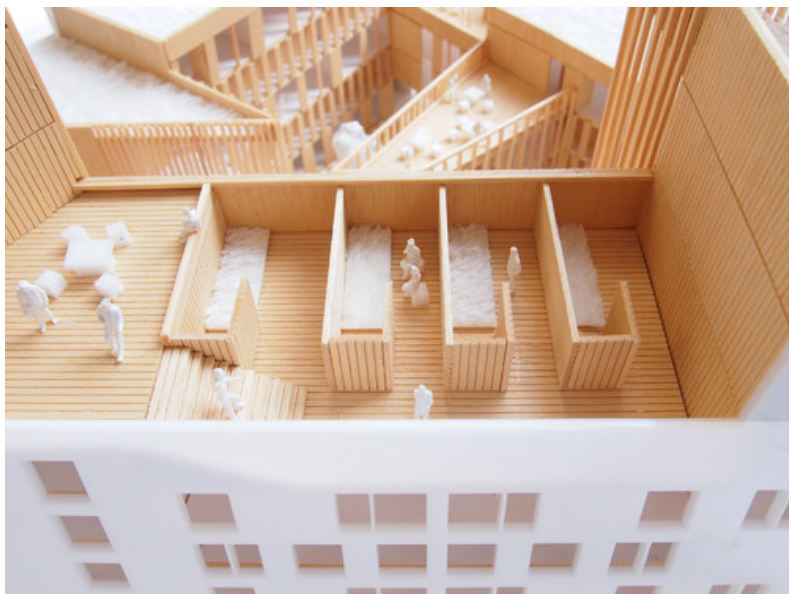
Maquette (exposition BMA - 2014) Â© ARJM architecture et urbanisme