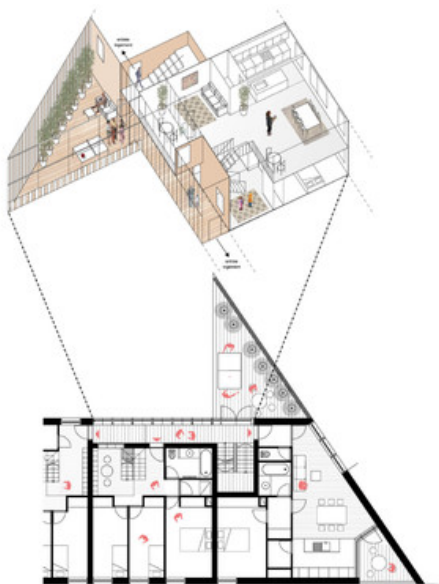
Â© ARJM architecture et urbanisme