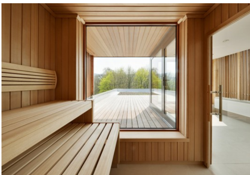
Â© Artau, Soci  t   d   architectures