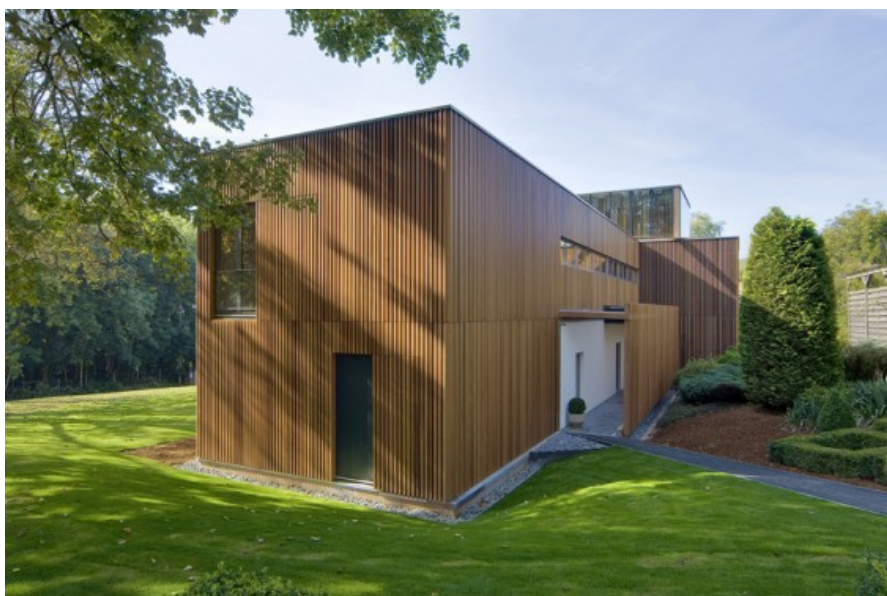
Â© Artau, Soci  t   d   architectures