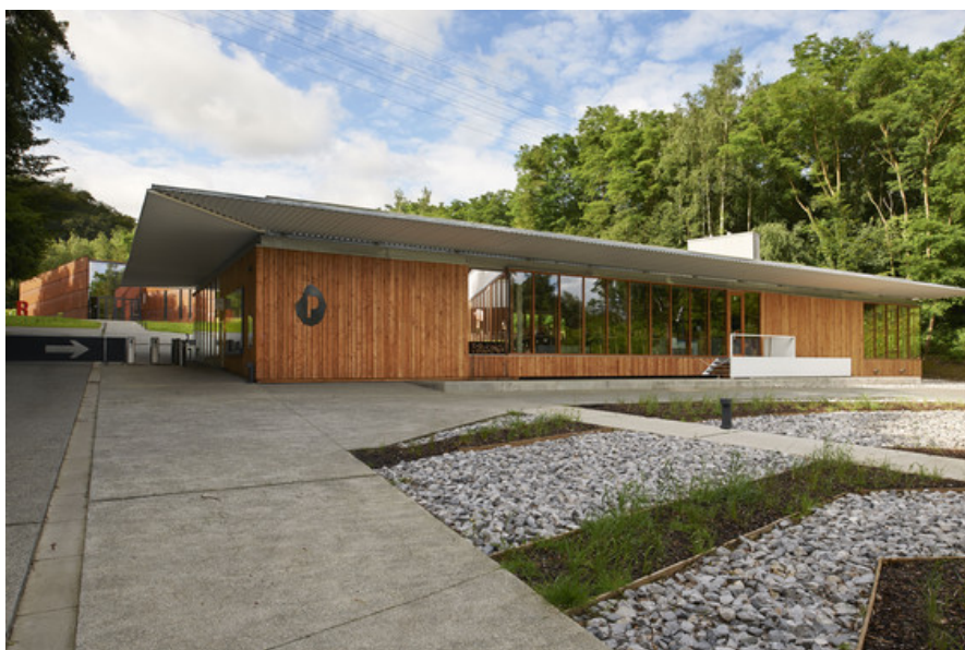
Foyer à l'entrée du site