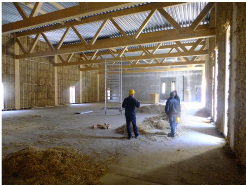
Chantier ossature en bois remplie de paille