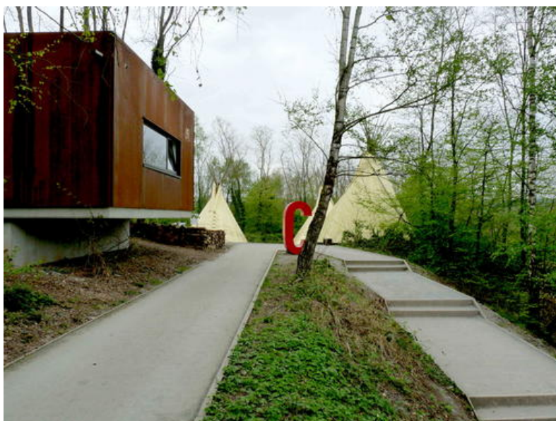
Un atelier