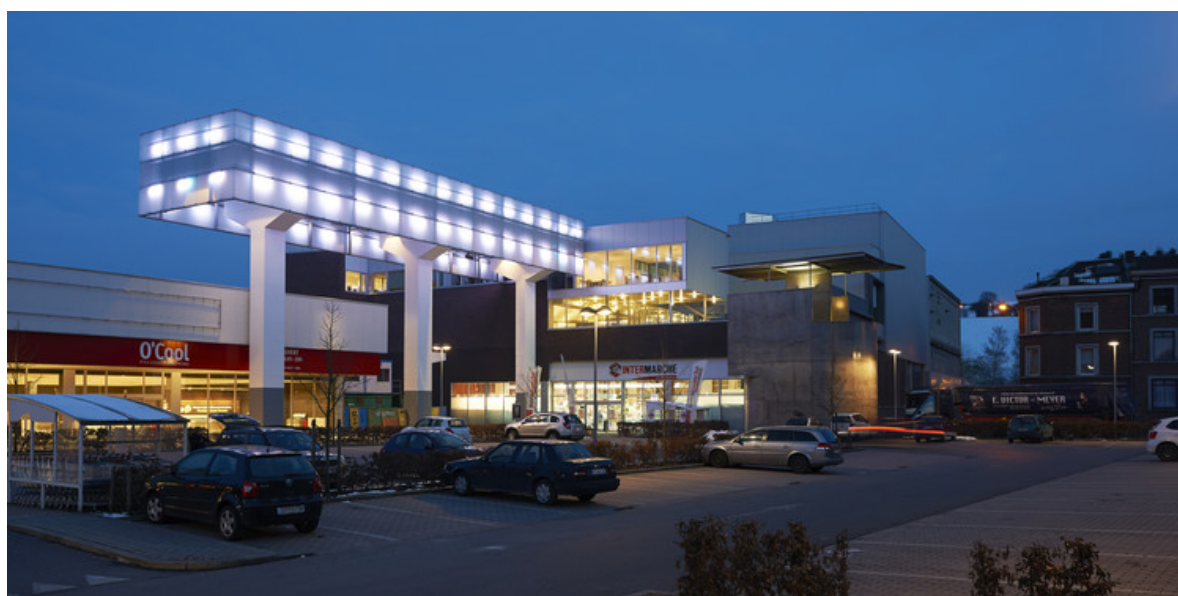
Â© Alain Janssens