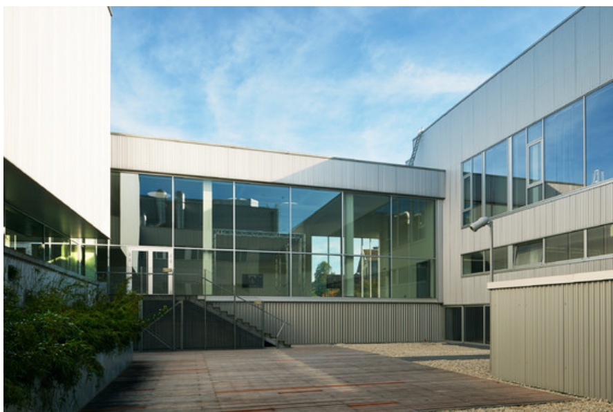
Â© Alain Janssens