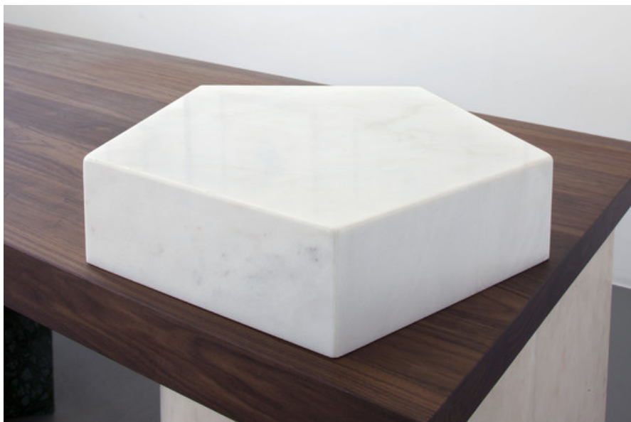
Â© Maxime Delvaux