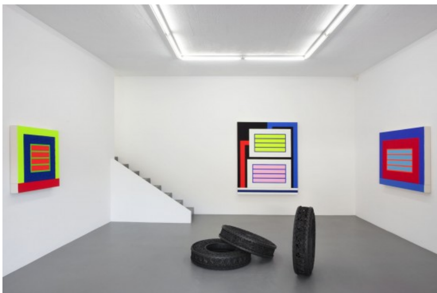
Â© Maxime Delvaux