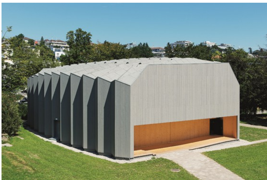
Pavillon en bois du théâtre de Vidy-Lausanne