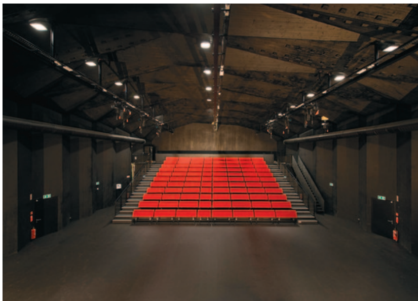
Pavillon en bois du théâtre de Vidy-Lausanne