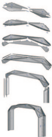
Axonomie d'assemblage © IBOIS