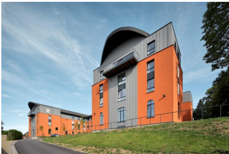
En majest      Creative Architecture sprl