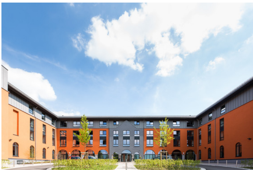
Vue de l'entr  e Â© Cr  ative Architecture sprl