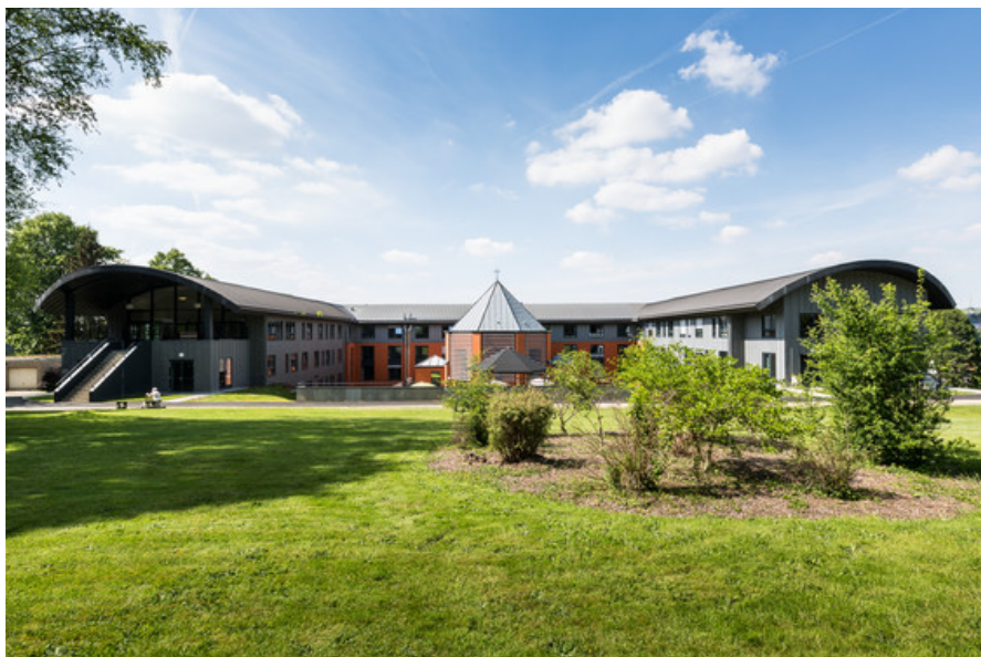
Vue du parc Â© Cr  ative Architecture sprl