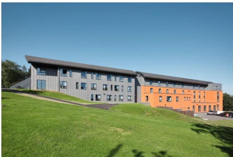
En longueur    Creative Architecture sprl