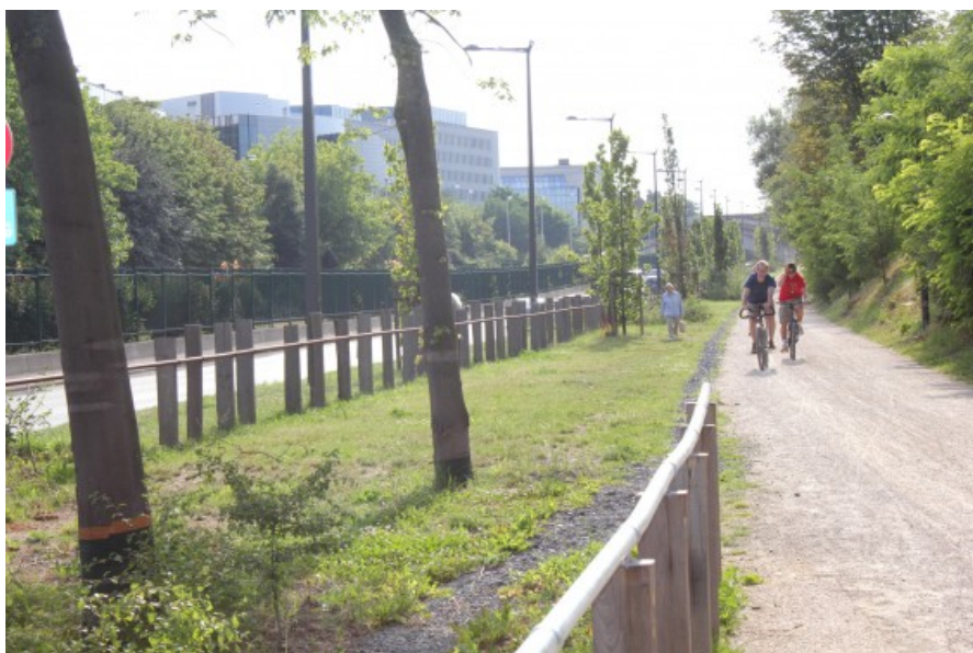
Une promenade le long de l'autoroute © Dessin et construction