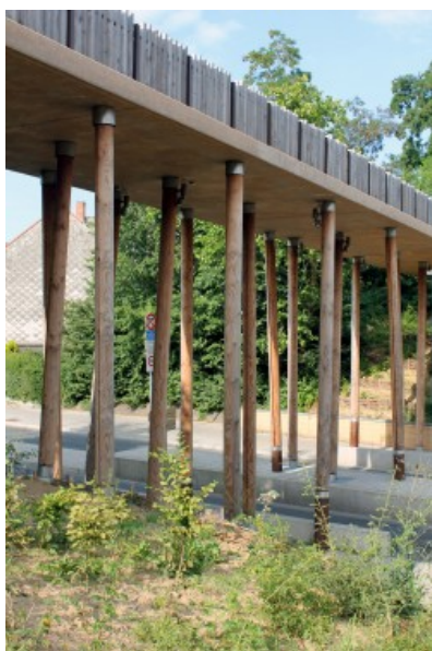
la passerelle affirme la présence de la voie verte et apporte une impression d'élancement contrastant avec la massivité du viaduc. © Dessin et construction