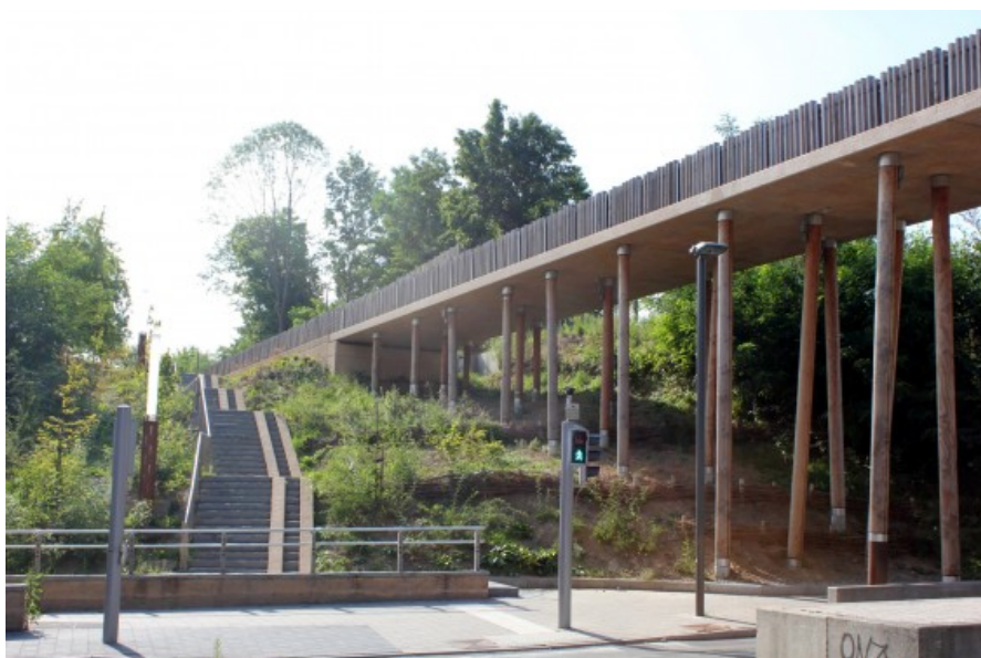
un jeu de pieux en bois rond couronnÃ©s d'une fine dalle de bÃ©ton instaure un rythme, une direction, un mouvement. Ã© Dessin et construction