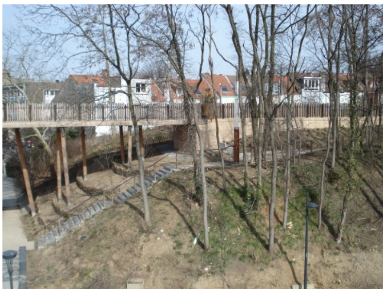
Le dessin de la clôture et du mur anti bruit forme une ligne continue perceptible depuis l'autoroute : vitrine de la Promenade. © Dessin et construction