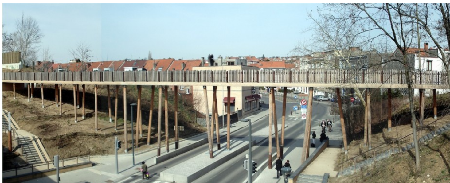
vue panoramique de la passerelle Ã partir de l'autoroute E411 Ã© Dessin et construction