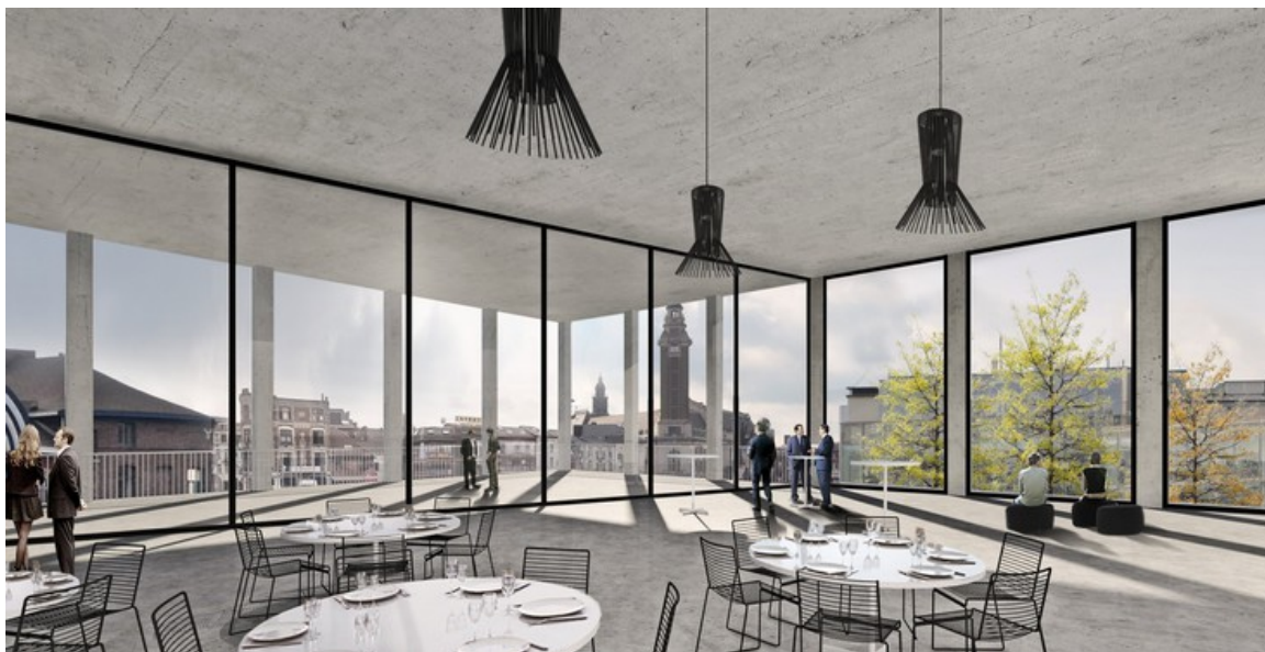
Vue salle event

Â© JDS architects - GOFFART POLOME ARCHITECTES