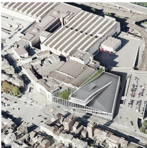
Vue perspective aérienne © JDS architects - GOFFART POLOME ARCHITECTES