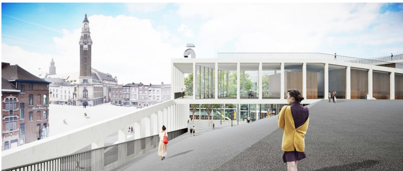
Vue toiture beffroi © JDS architects - GOFFART POLOME ARCHITECTES