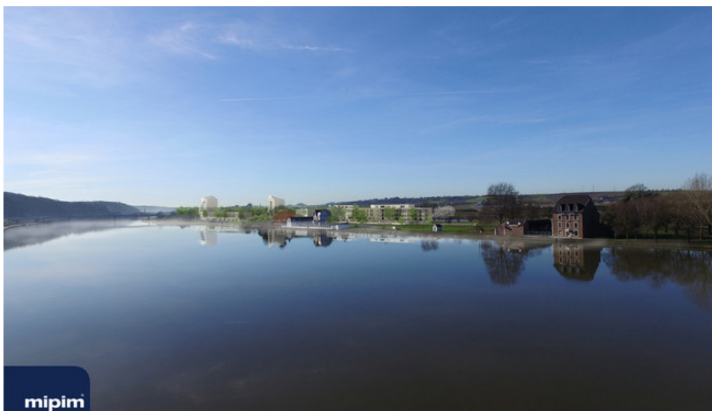
MEUSE VIEW - Immobilier