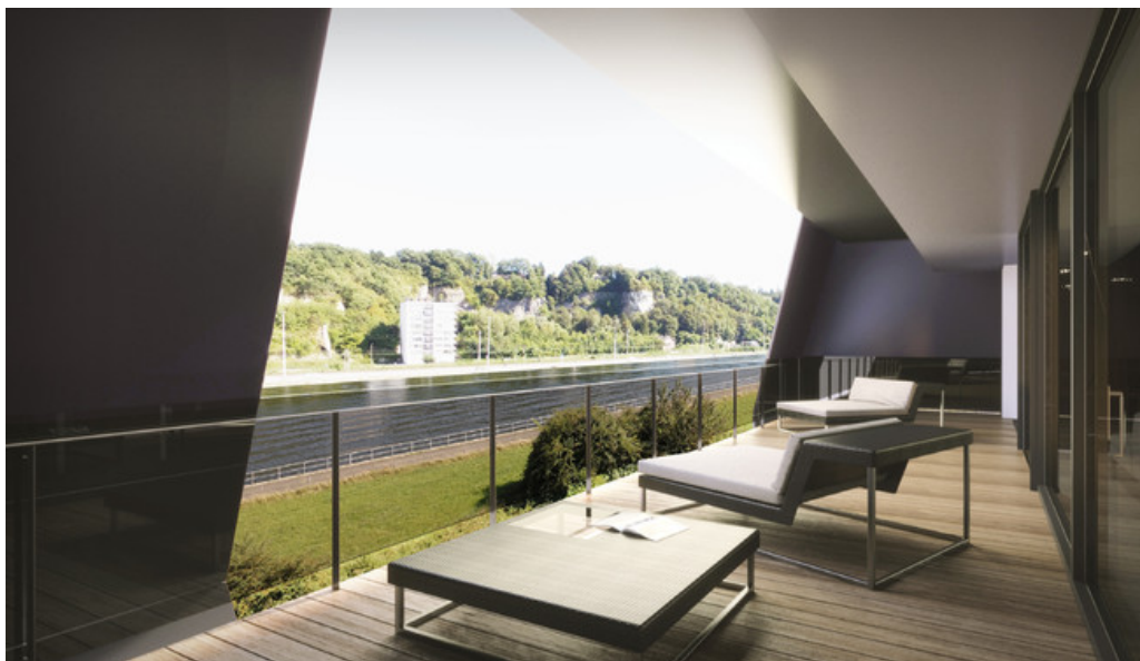
MEUSE VIEW - Terrasse