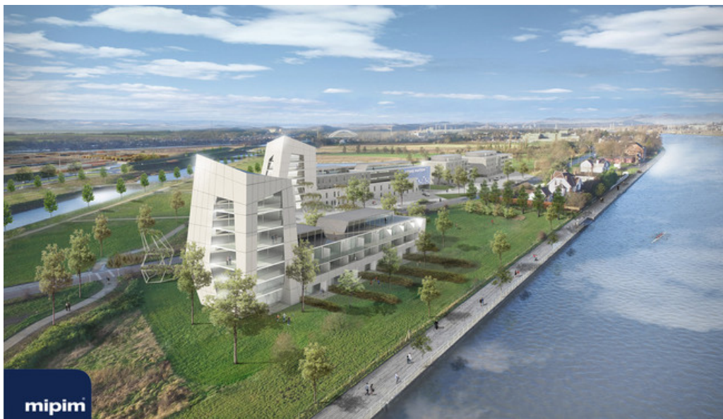
MEUSE VIEW - Immobilier