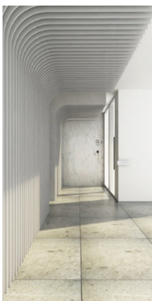
MEUSE VIEW - Hall d'entr e