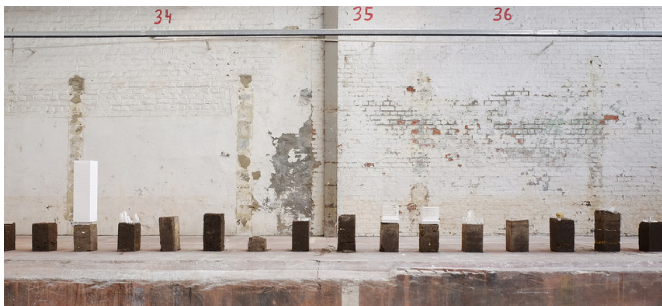
Â© MAMOUT architectes