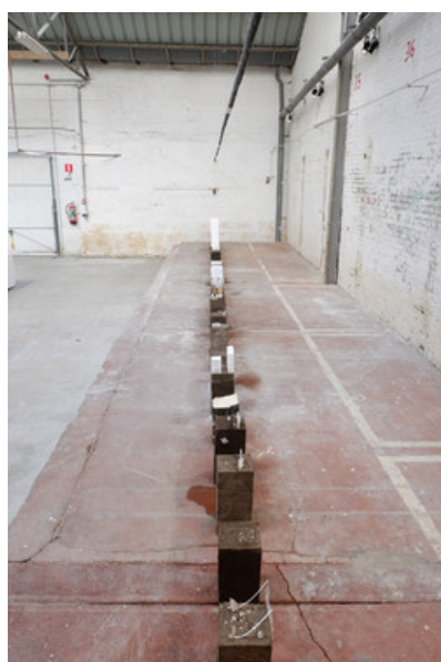
Â© MAMOUT architectes