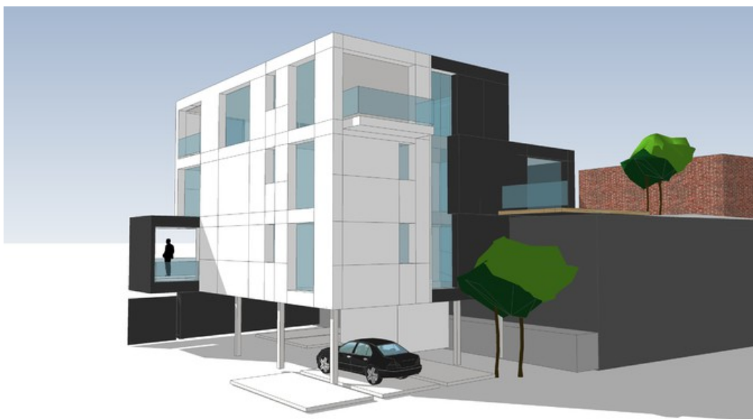
Â© PLAN 9, Bureau d'Architectes sprl