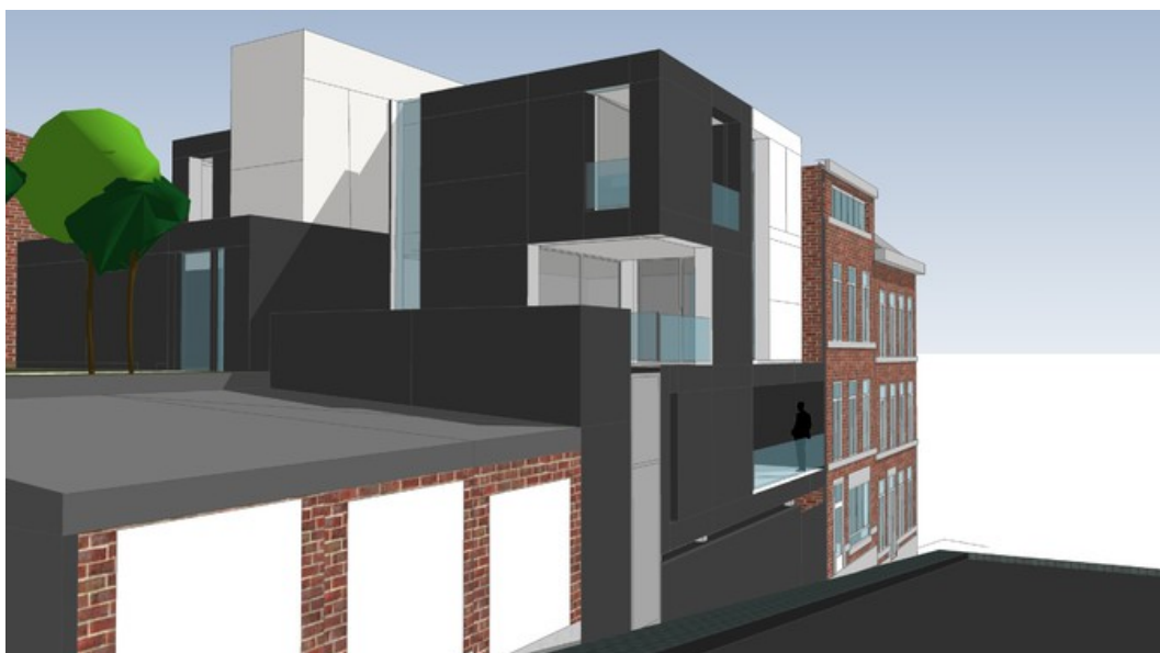
Â© PLAN 9, Bureau d'Architectes sprl