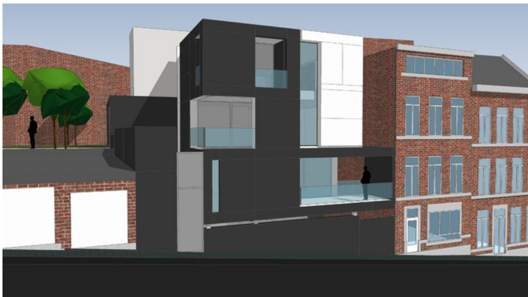
Â© PLAN 9, Bureau d'Architectes sprl