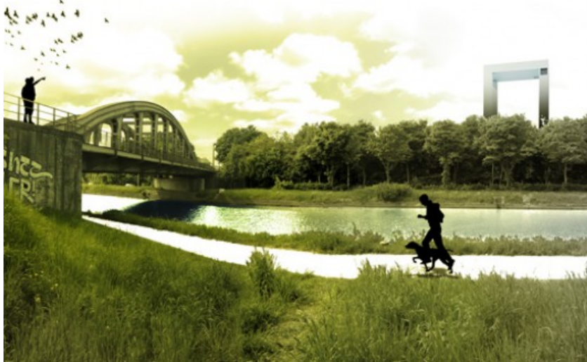
Â© RESERVOIR A - ARCHITECTES