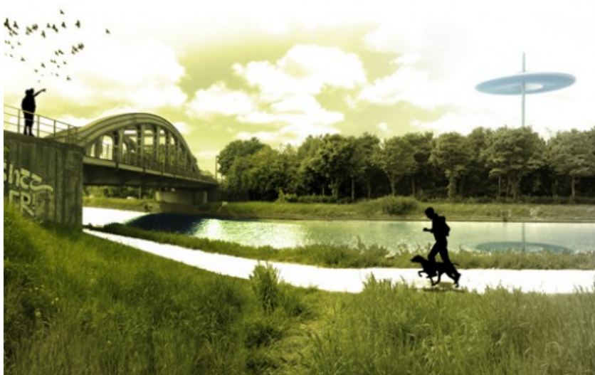
Â© RESERVOIR A - ARCHITECTES